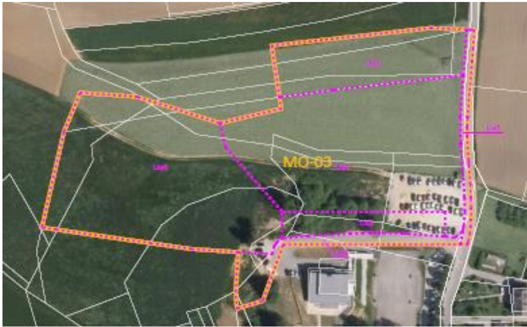
Slika 1: Prikaz lege ureditvenega območja v prostoru