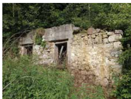
Majcetov mlin