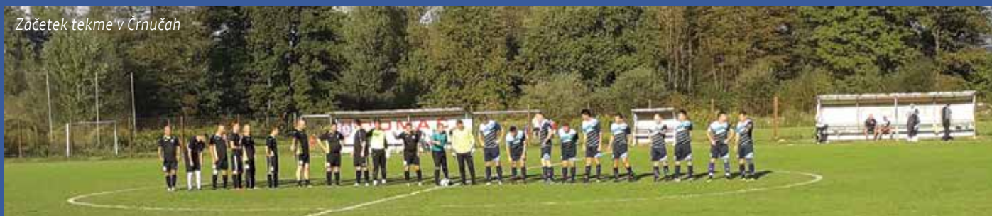
Začetek tekme v Črnučah

V eteranska ekipa je v prvem delu letošnje sezone tista, ki kaže najboljše rezultate. Izvrstno spomladansko formo so po nekaterih okrepitvah in pomladitvah ne samo zadržali, pač pa jo celo izboljšali. Najprej je potrebno spomniti, da so veterani ekipe Moravče-Lukovica v zadnji sezoni osvojili visoko drugo mesto, zaostali so le za Črnučami.