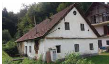
Križev mlin