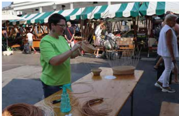
Rokodelstvo se je razvilo na kmetijah, zato na takšne prireditve, kot je Podeželje v mestu, sodi tudi prikaz rokodelskih veščin. Tokrat smo se osredotočili na pletenje košar, ob tem pa še ponudili izjemen rokodelski nakit in pletenine.

Čeprav gre v primerjavi z ovčarskim balom za znatno mlajšo prireditev, pa vseeno že vstopa v drugo polovico »najstništva«. Po skoraj petnajstih