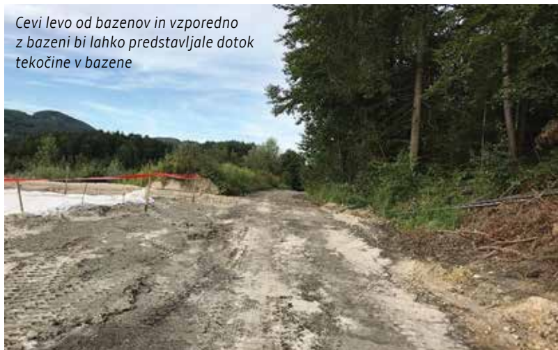
Cevi levo od bazenov in vzporedno z bazeni bi lahko predstavljale dotok tekočine v bazene

Priporočilo Inštituta Jožef Stefan je jasno, ko pravi: »Zaradi izhlapevanja hlapnih kemikalij in onesnaženja tal zaradi pronicanja, razlivanja ali morebitne netesnosti plastične folije na dnu bazenov« in nato »odpadna voda iz omenjenih bazenov bi lahko v primeru puščanja ali izlivanja iz bazenov ogrozila podtalnico in površinsko vodo Drtijiščico«.