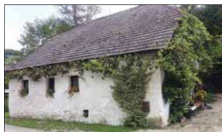
Lesjakov mlin