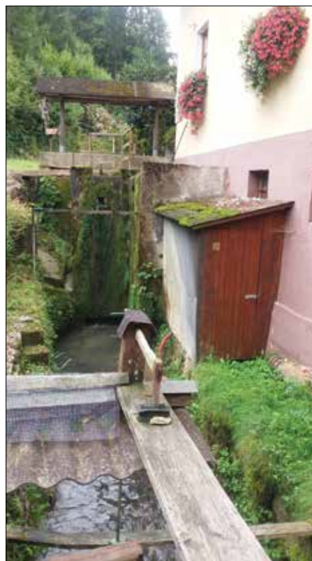
Lukov mlin

Mlini so odropotali v zgodovino. A kot se zdi, bodo še dolgo ropotali v pogovorih med ljudmi.