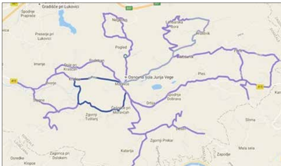
Grafični prikaz linij poti šolskih prevozov

BESEDILO: ALENKA PRELOVŠEK IN PETRA PETERKA