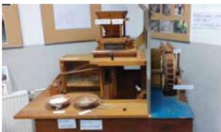
Maketa mlina