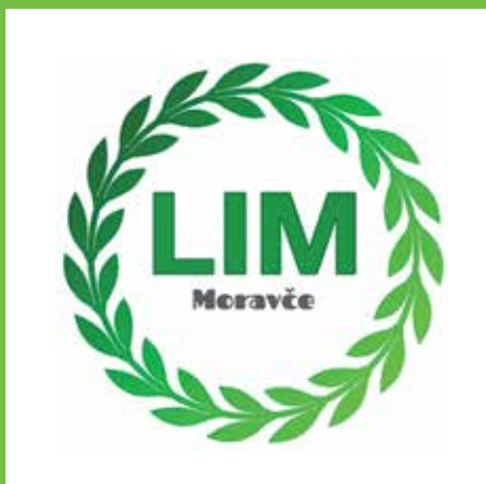
Ljudska iniciativa Moravče

Na Inštitutu Jožef Stefan so tako ugotovili, da improvizirani bazeni, ki so narejeni z izkopom na nasutem terenu in prekriti z belo plastično folijo predstavljajo ogrožanje okolja, saj niso zaščiteni z ograjo in v katere se najverjetneje nekontrolirano odlagajo odpadne vode neznanega izvora, lahko tudi s strani nepooblaščenih oseb ali podjetij. Konstrukcija bazenov, globina in odtoki bazenov na terenu niso označeni ali opisani. Prav tako ni opozorilnih tabel, ki bi naključne sprehajalce opozarjale na nevarnost ali omejen dostop. Odpadna voda neznanega izvora v teh bazenih predstavlja vir onesnaženja zraka zaradi izhlapevanja hlapnih kemikalij in onesnaženja tal