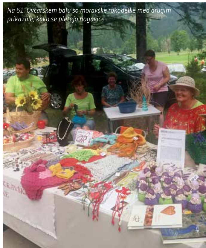
Na 61. Ovčarskem balu so moravške rokodelke med drugim prikazale, kako se pletejo nogavice.

Letos je potekal že 61. ovčarski bal. Na prireditvi, ki je namenjena pozdravu prihoda planšarjev in ovc iz planin v vasi, v senci dreves ob jezeru želijo organizatorji prikazati stare običaje življenja na planini in tiste, ki so povezani s predelavo volne. Seveda dogodek popestrijo tudi z drugimi prikazi in dejavnostmi, kakor tudi z degustacijami in kulturnim programom. Obiskovalci se lahko okrepcajo s starimi jedmi, pripravljenimi na odprtem ognjišču, kot so masunjek s kislim mlekom ali ajdovi žganci z zeljem.