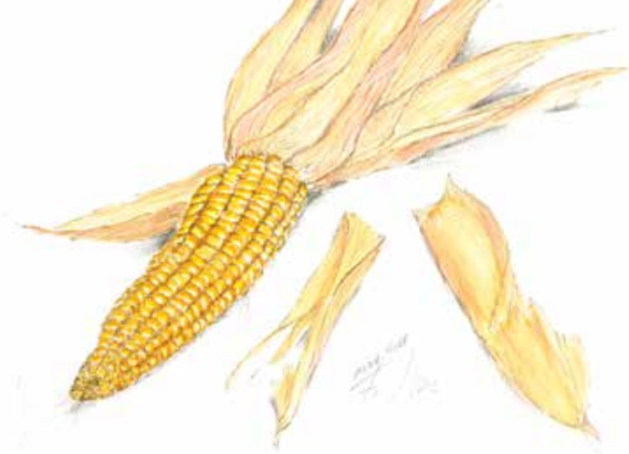
Franc Ovsec, Zlato zrno , 2011 akvarel na papirju, 17,8 x 25,4 cm

Koruso so sejali na vsaki kmetiji, jeseni je bilo potrebno pridelek pospraviti. Na vasi so ljudje živeli v sožitju z naravo in drugimi ljudmi. Povsem običajno je bilo, da so si medsebojno pomagali pri delih na polju. Ob koncu opravljenega dela so imeli »likof«, zaključek dela z malico, ki so se ga veselili stari in mladi, saj se je večkrat spremenil v pravo veselico, na kateri so fantje osvajali dekleta.