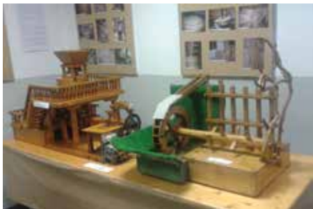
Maketa Šimnovega mlina