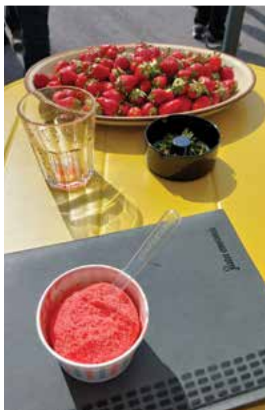
Eko kmetija Penko