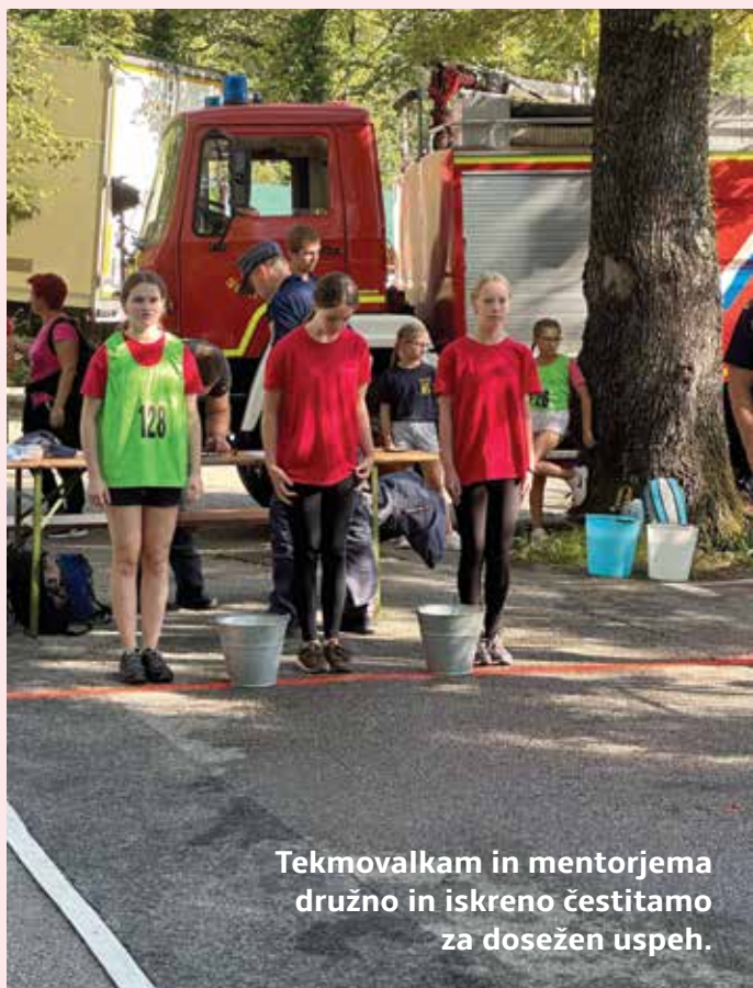
Tekmovalkam in mentorjema družno in iskreno čestitamo za dosežen uspeh.

in topografski znaki. Rezultati s posameznih vaj se upoštevajo pri razdelitvi mest. Orientacijske sposobnosti mladih so tokrat preizkušali v bližnjem gozdu Panovec.