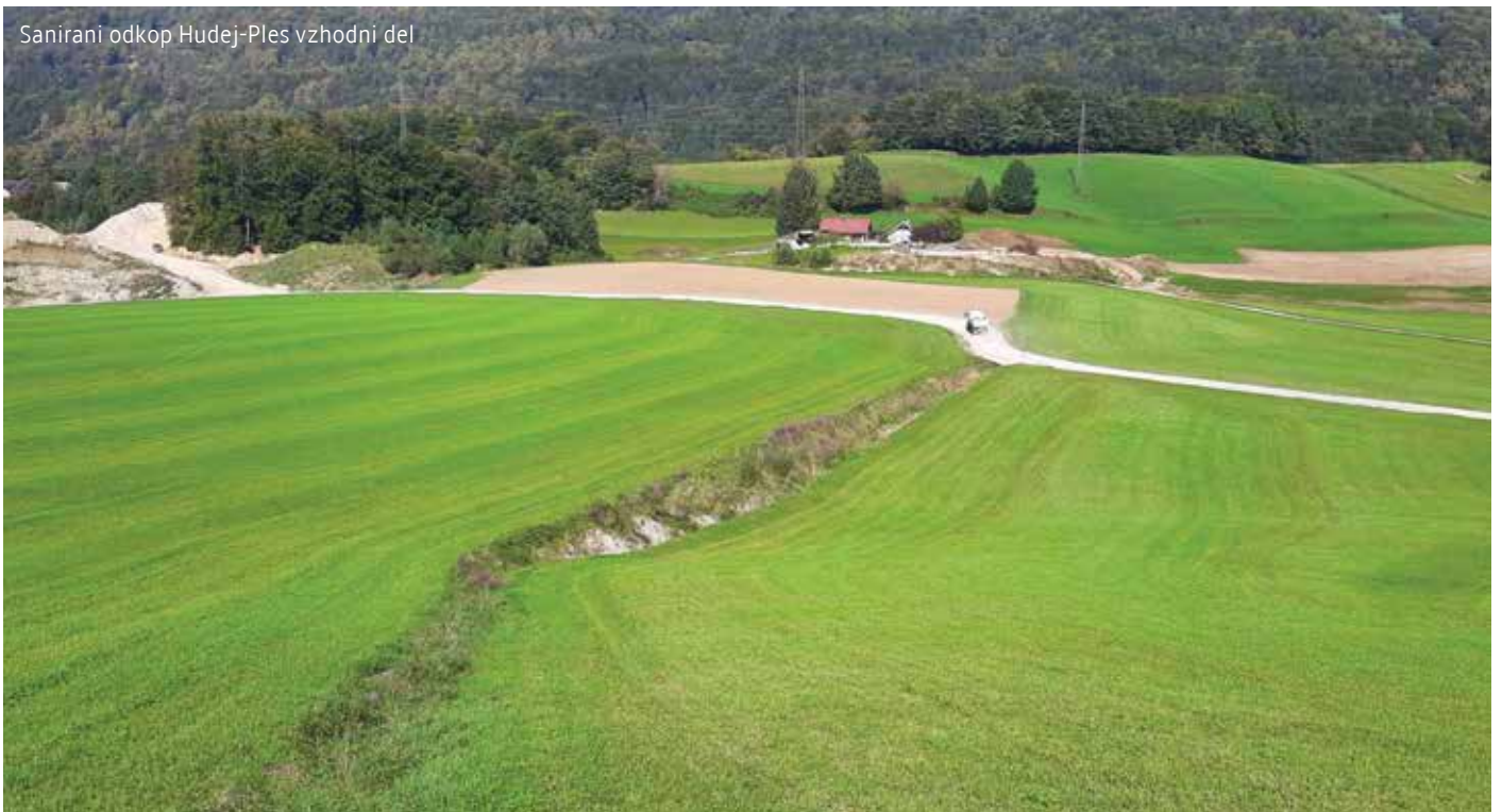
Sanirani odkop Hudej-Ples vzhodni del

13. Podjetje Termit bo po prehodnem obdobju dveh let prenehalo z izkopom mineralnih snovi na območju Nature 2000. Na tem področju (Mošenik-